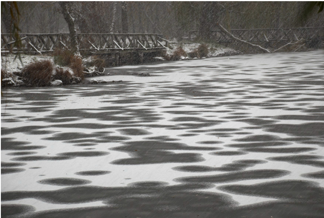
I. díjas kép: Havaseső a Mátrában

http://artportal.hu/aktualis/hirek/wagner_istvan_romanmagyar_koezoes_eso