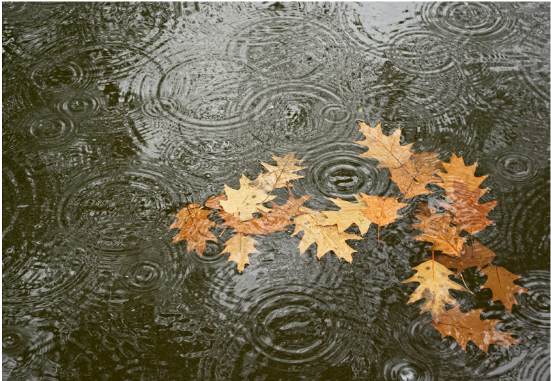
Ezüstérmes kép: Őszi eső